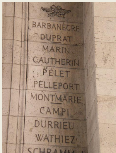
Arc de Triomphe pilier Est

La mort qu'il a si souvent bravée sur les champs de bataille le rattrape. Pierre de Pelleport, meurt à Bordeaux le 15 décembre 1855 à l'âge de 82 ans.