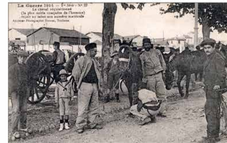
Réquisition d'un cheval dans la région toulousaine, on lui fixe son numéro matricule sous un sabot. Durant la guerre, les réquisitions successives s'élevèrent à 950 000 chevaux. On estime à 760 000 le nombre de chevaux tués pendant cette période. La France rurale aura perdu ses bras les plus vigoureux et sa force de travail.

Archives départementales de la Haute-Garonne cote FRAD031_00001_NUM_46_000103