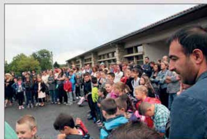
▲ Enfants et parents dans la cour