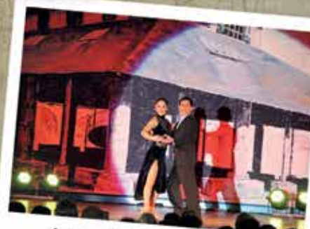
Août : L'Argentine et le tango à l'honneur au Festival