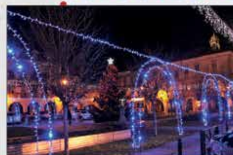
Un effort particulier a été porté pour les illuminations de la place