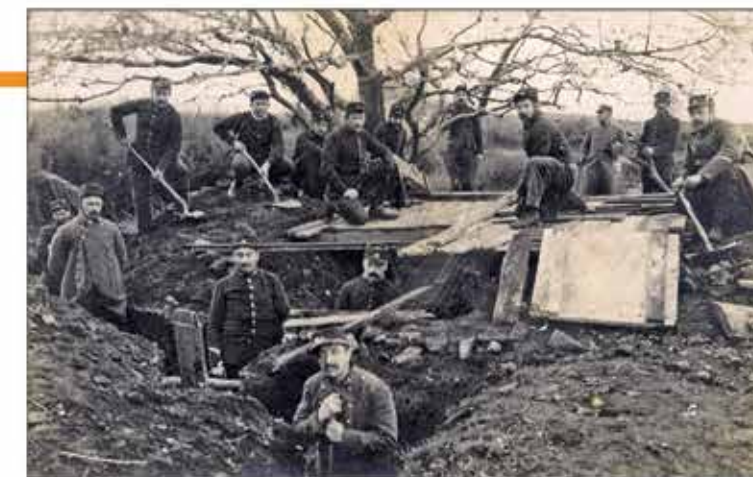
Des soldats du 14 ème régiment d'infanterie creusent une tranchée.