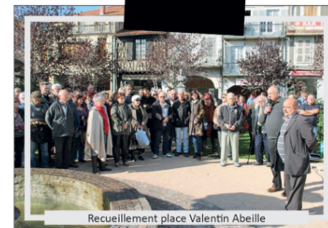
Recueillement place Valentin Abeille