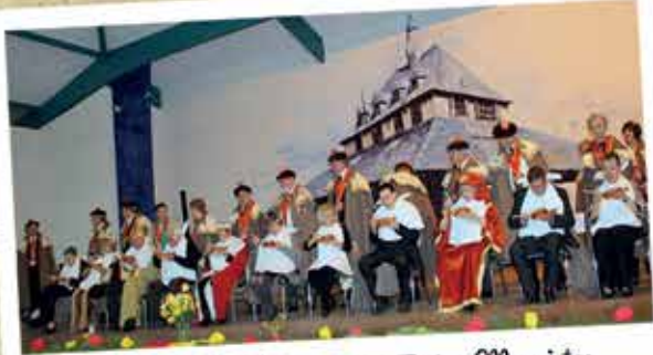
Mars : 29 ème Chapitre des Tastos Mourjetos