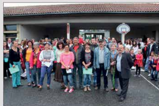
▲ Tout le monde est fin prêt pour la nouvelle année scolaire