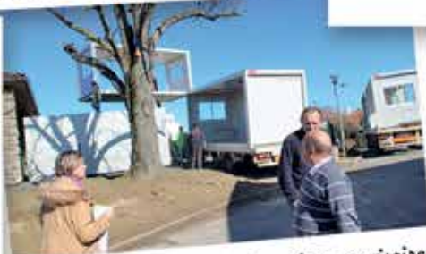
Mai : Mise en place de bungalows provisoires après l'incendie de l'école du Courraou