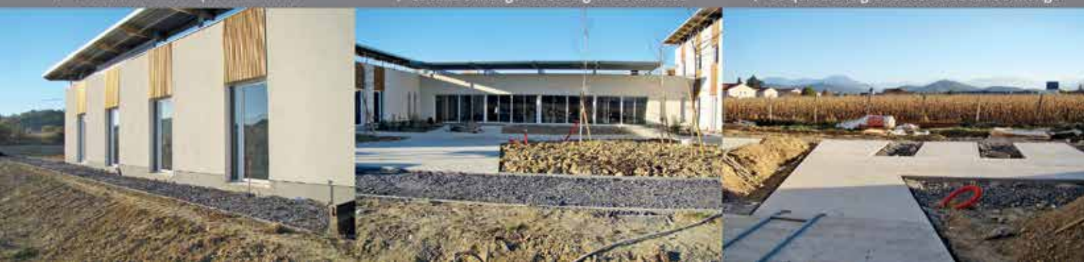
▼ Ce qui sera la grande terrasse salle à manger