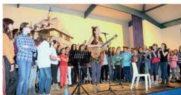
Mars : Festival Passa Ports