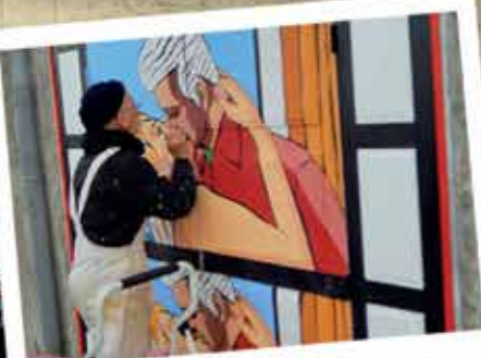
Octobre : Les préparatifs pour la réouverture des Variétés