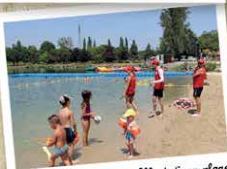
Juillet : Ouverture de Montréjeau plage