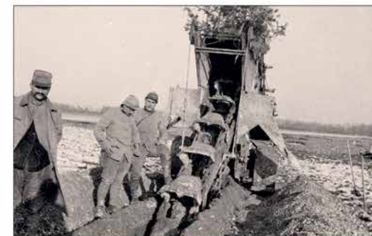
Tous les boyaux et tranchées n'ont pas été creusés à la main. Quelquefois les machines ont bien aidé les hommes. Quelques branches d'arbre déposées sur la machine font office de camouflage.

Archives départementales de la Haute-Garonne cote FRAD031_00001_NUM_46_000103