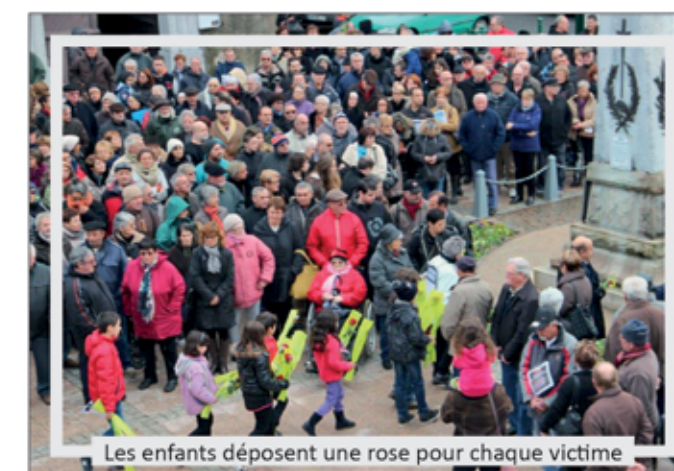
Les enfants déposent une rose pour chaque victime