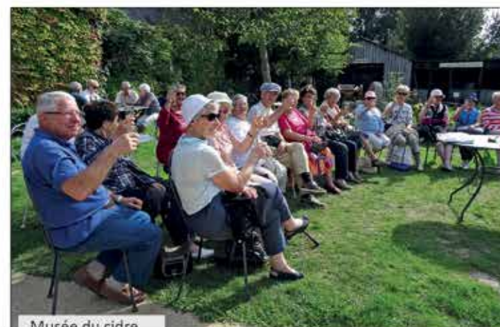
Musée du cidre