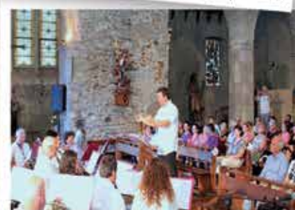
Juillet : L'orchestre philharmonique de Trie-sur-Baïse à l'église Saint Jean