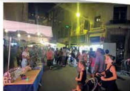
Août : Marché de Nuit