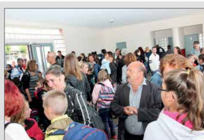
▲ Monsieur le Maire accueille les familles