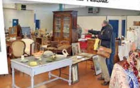
Octobre : La Foire à la Brocante ouvre ses portes