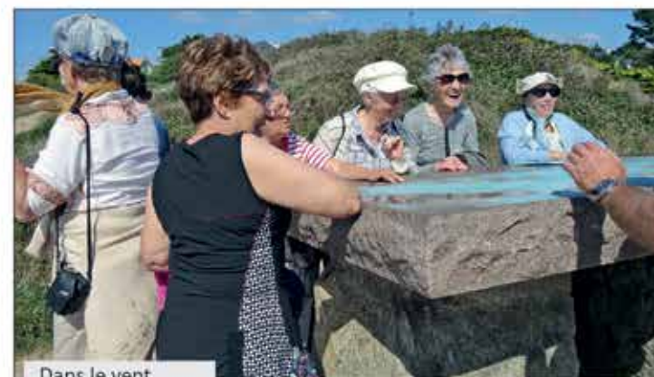
Dans le vent