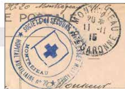
Tampon de l'hôpital auxiliaire n°20 au couvent Sainte Germaine à Montréjeau, daté du 11 novembre 1915.