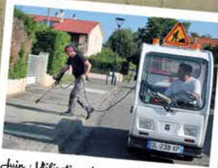
Juin : Utilisation de nouveaux équipements