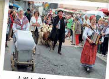
Juillet : Marché à l'Ancienne