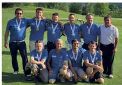
Mai : Le Golf du Comminges accède à la 3 ème division Nationale