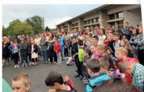
Septembre : Une rentrée scolaire réussie