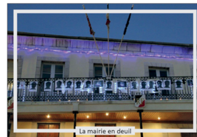
La mairie en deuil