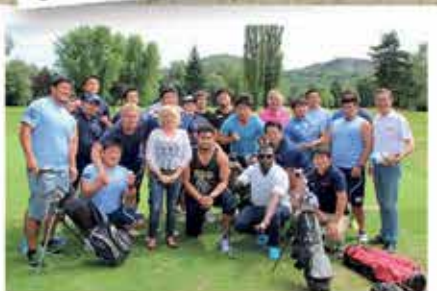
Juillet : L'équipe de Yamaha Jubilo Championne de rugby du Japon 2014-2015 en visite à Montréjeau