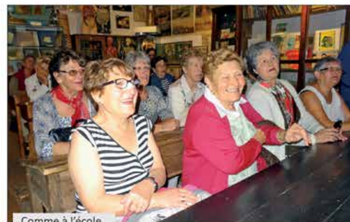
Comme à l'école