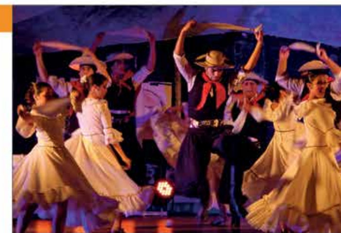
L'Argentine au Gala d'ouverture Folklor 2015 ▲

Certaines modifications peuvent intervenir lors de l'assemblée générale de l'association.