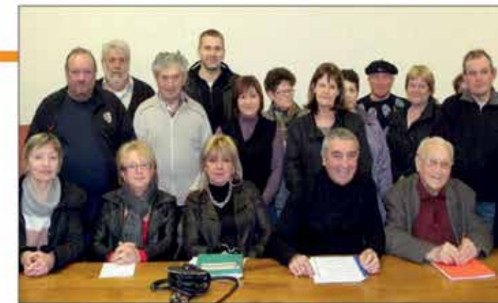
L'assemblée générale 2014 ▲