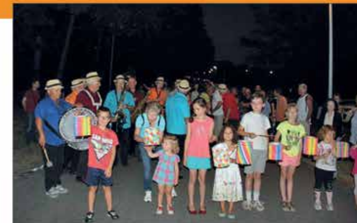
Les enfants se préparent pour la retraite aux flambeaux du 14 juillet ▲

Le 20 décembre vous pourrez faire vos achats au marché de Noël qui se tiendra le 20 du mois sous la petite halle et la place Valentin Abeille.