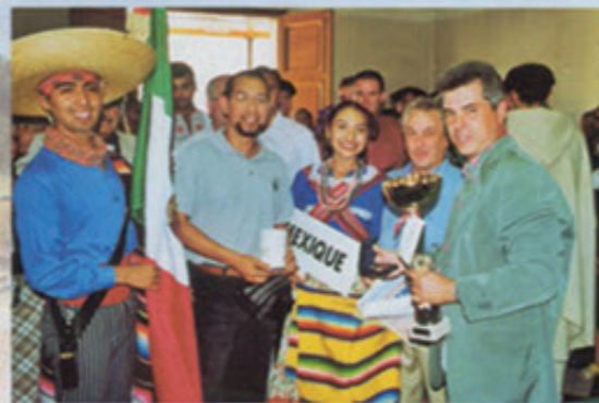
Un aspect convivial de cette manifestation, l'échange des cultures et des présents. Ici, les représentants du Mexique avec le Maire et le président du COFIF.

Le pari gagné, l'équipe de volontaires, composant le COFIF, s'est remis au travail afin de nous concocter un majestueux 43 ème Festival International de Folklore.