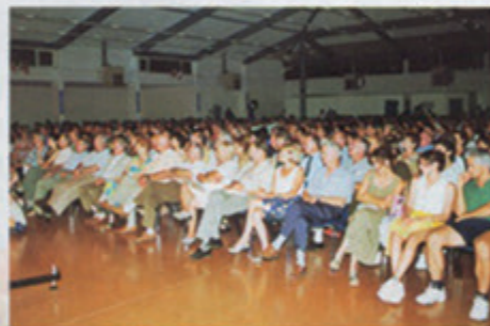
Du monde très attentif à l'évolution des artistes...