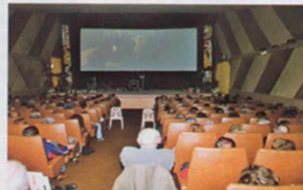
La salle de cinéma pour sa réouverture

Une soirée ciné à Montréjeau, c'est désormais une réalité avec la réouverture depuis le dimanche 1er décembre du cinéma "Les Variétés". Ce projet n'a pu se réaliser sans la contribution d'un mécène qui, par amour du cinéma, nostalgie des lieux, a racheté le cinéma pour en offrir l'exploitation à la commune. La municipalité a sauté sur l'opportunité et mis en œuvre le maximum pour faire de cette réouverture un événement culturel dans notre cité qui en manquait si cruellement. Grâce à l'implication des employés municipaux