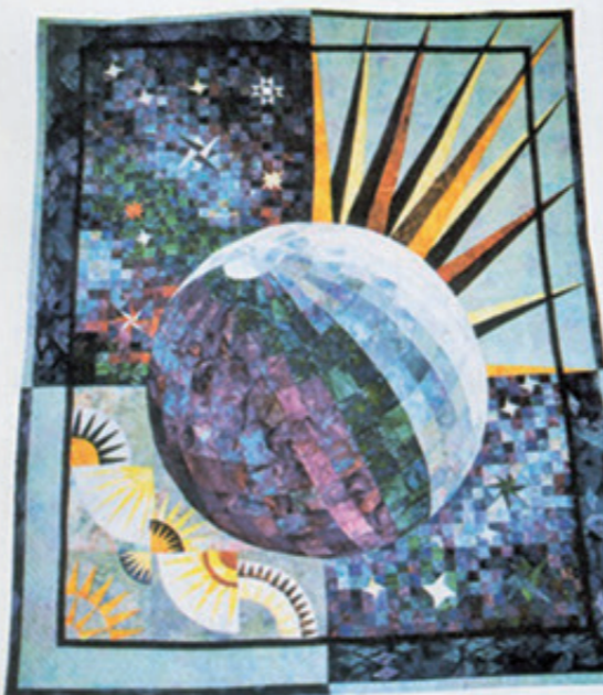
Pachwork dans la salle espace de l'Euro