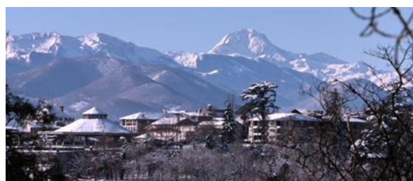
Un positionnement géographique stratégique