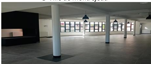
Une salle de restaurant de 170 m 2 avec terrasse