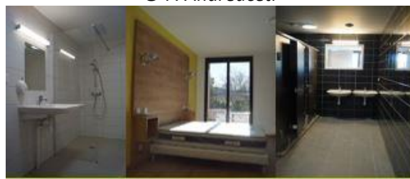
Un concept au design moderne 3 étoiles