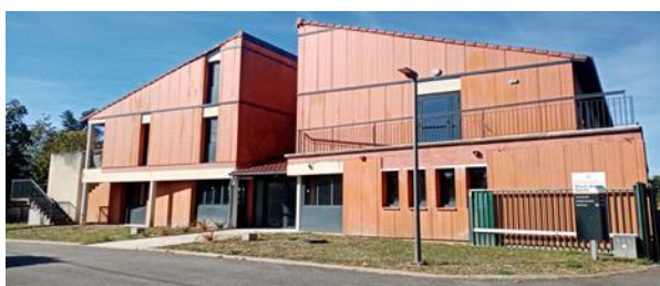
Une résidence hôtelière entièrement rénovée

Une base de loisirs gratuite et labellisée portée par la municipalité draine un flux touristique important. Le tracé de la randonnée Via Garona qui relie Toulouse à Saint Bertrand-de-Comminges passe à proximité (étape 7 du tracé – 24 km entre Saint Gaudens et St Bertrand) tout comme un Golf de 9 trous.