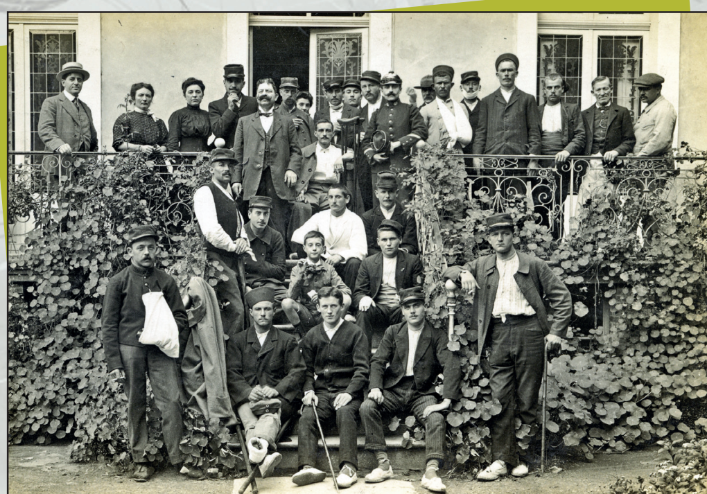
Luchon : Transport de blessés devant le Casino.