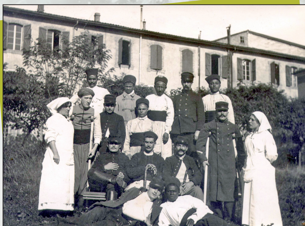
Luchon : des soldats convalescents devant un hôtel, après avoir été soignés à l'hôpital complémentaire n°54, hôtel thermal.