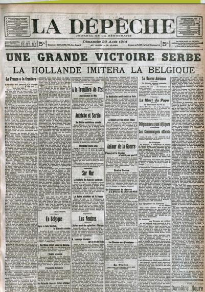
Conseil Général de la Haute-Garonne - Archives Départementales Jour27_1914_Sec009

Le 5 octobre 1914, le Préfet de la Haute-Garonne envoie des directives strictes et précises pour la mise en place de la censure de la presse Saint-Gaudinoise.