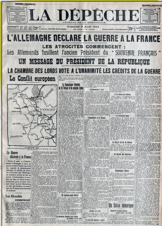
Conseil Général de la Haute-Garonne - Archives Départementales Jour21_1914_Sec01

Le 3 août déclaration de guerre de l'Allemagne à la Serbie et à la France.